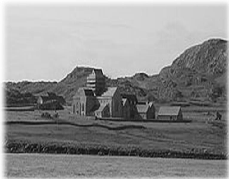
Abdij op het Schotse eiland Iona